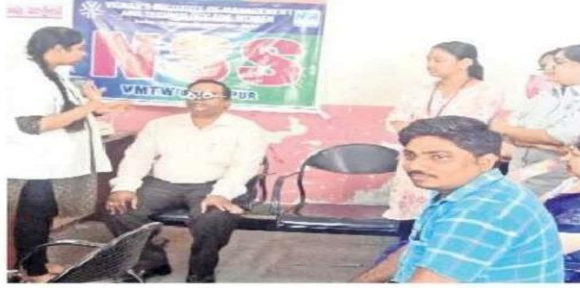
కొండాపూర్ విజ్ఞాన్ మహిళా కళాశాలలో అధ్యాపకులకు కంటి పరీక్షలు